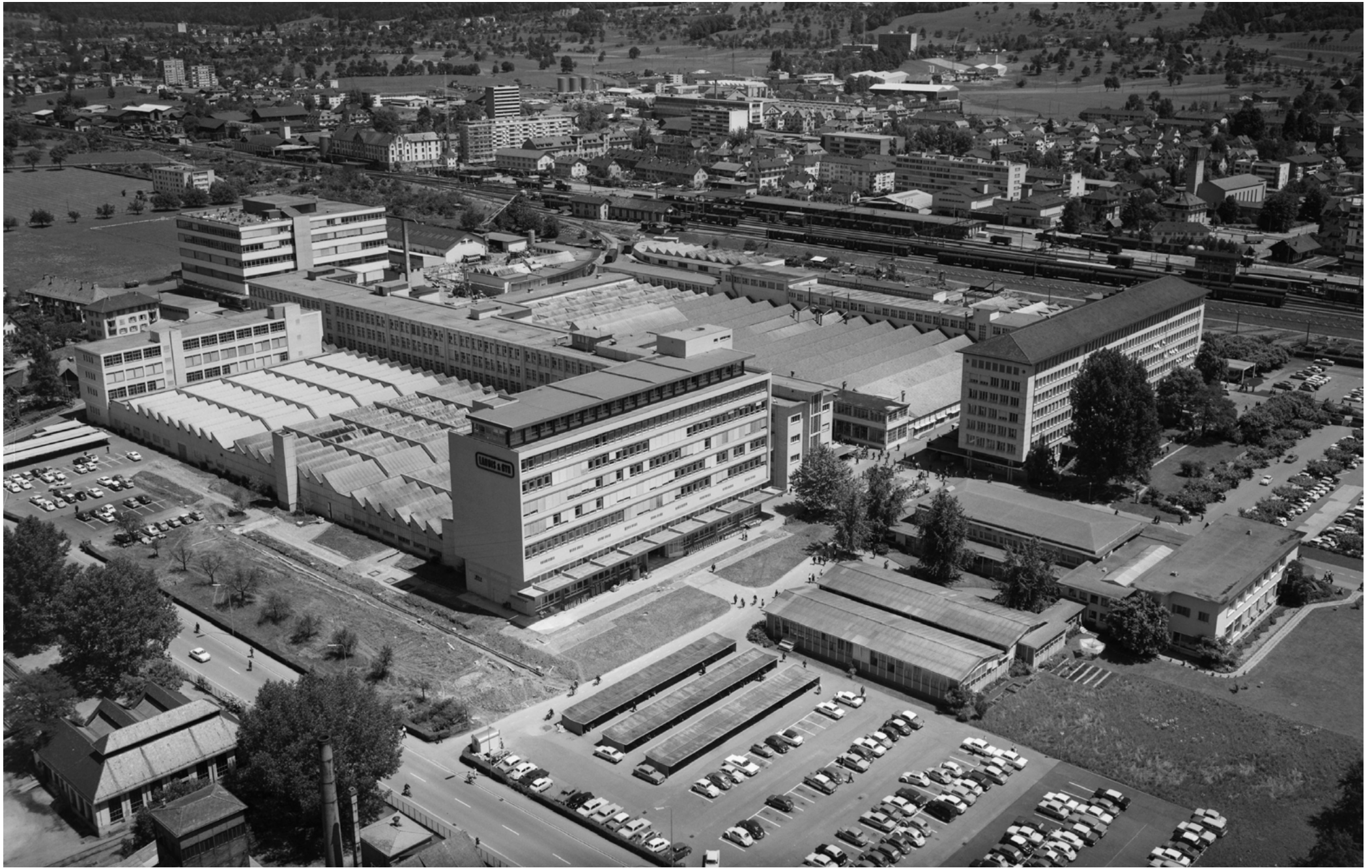
Das Landis & Gyr Areal am 22.6.1966.