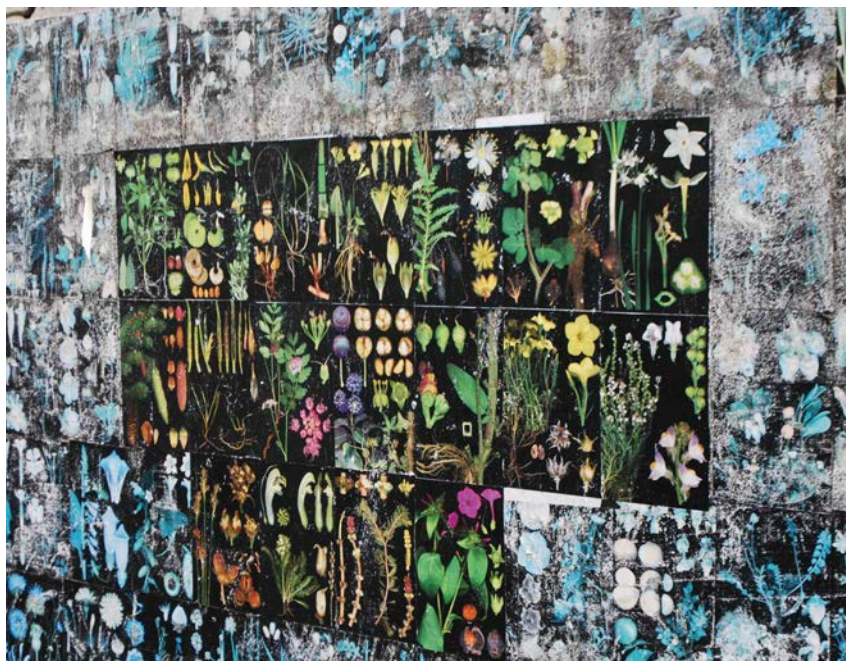
Sonder l'espace de vie qu'est la ville: photo de la visite guidée «Pickeltour» après l'Assemblée générale 2012 à Zurich.

En plus d'effectuer ce travail sur sa propre histoire, il s'agit également pour le Werkbund de mettre des accents sur certains thèmes et d'aborder des questions qui lui sont importantes. A cette fin, des représentantes et représentants des comités des groupes régionaux ainsi que du comité central ont défini en novembre passé des théma-