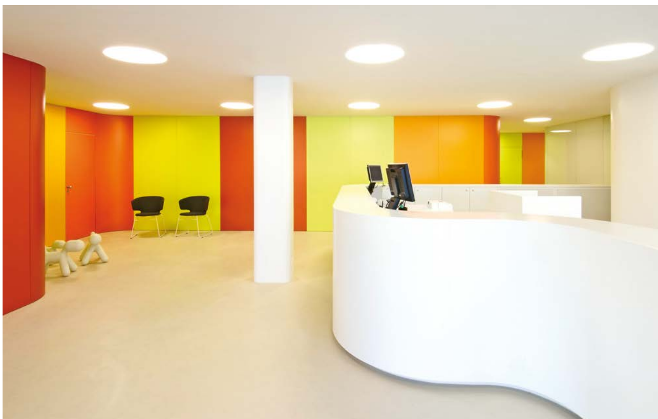
Transformation de la banque Raiffeisen de Sargans – A. Christen.

avons trouvé une commode mesurant environ 0.8x1.2x0.3 m dont les 19 tiroirs étaient remplis de toute sorte d'outils, vis, etc. et de beaucoup de cassettes de tubs bizarres des années 60 et 70. Nous avons laqué ce meuble en blanc laissant visibles toutes ses traces d'utilisation. Depuis, il est à côté de la porte d'entrée, très pratique: la famille utilise beaucoup ses tiroirs pleins de fourbi.