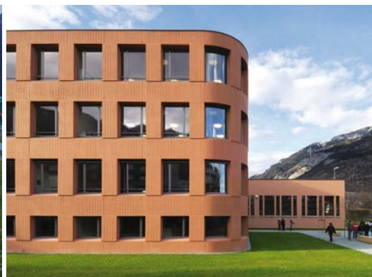
Agrandissement et transformations du gymnase Giacometti de Coire - A. Christen & C. Drilling.