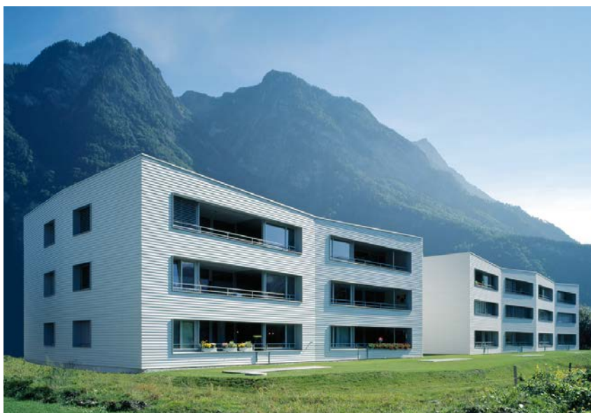
Nouvelle construction, ensemble résidentiel Stadel, Balzers - A. Christen & I. Cavegn.

Dans la cave du propriétaire précédant ayant déménagé il y a déjà des années, nous