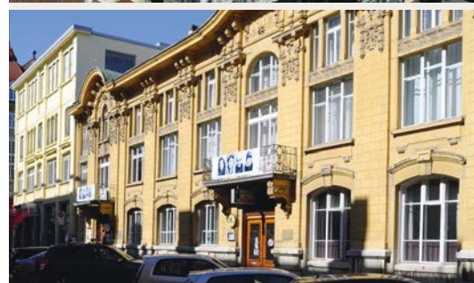
La Chaux-de-Fonds et le Club 44.