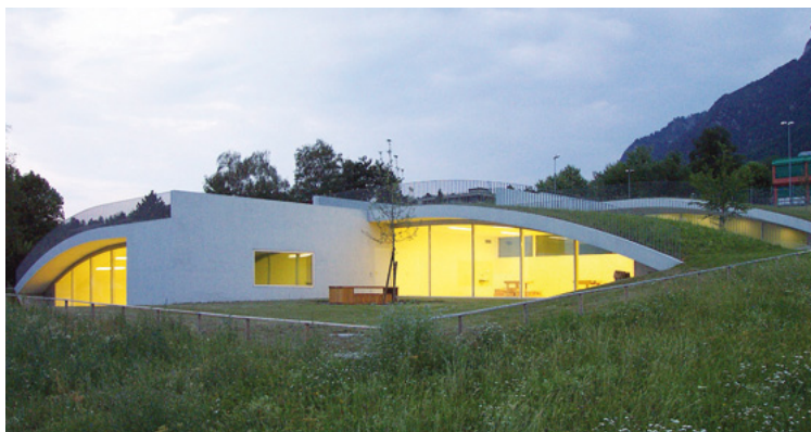
Ensemble triple de jardin d'enfants, Vaduz – A. Christen & J. Ritter.