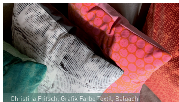
Christina Fritsch, Grafik Farbe Textil, Balgach