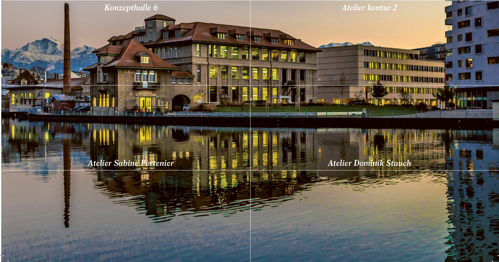
Atelier Dominik Stauch