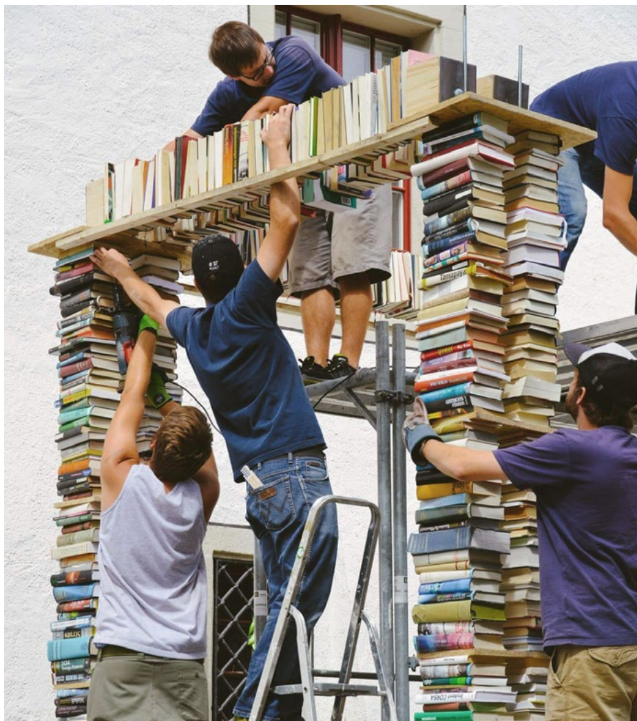
Viele Arbeitsschritte und Hände waren nötig, um die Bücherpavillons für die Badenfahrt 2017 zu bauen.