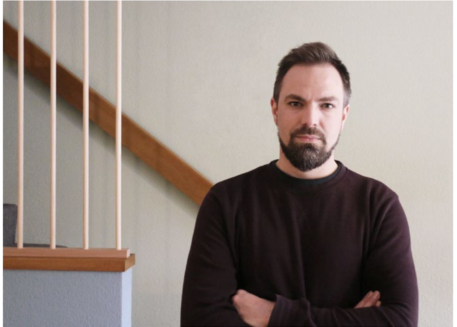
Alexander Marty. Foto: SuM Architekten GmbH, Baden.

Städtebaulich besetzt der Neubau eine exponierte Stelle. Er steht an der Grenze zum benachbarten katholischen Kirchgemeindezentrum von Luigi Snozzi und Bruno Jenni und überbaut eine bestehende Aussenmauer des Ensembles. Gleichzeitig erweitert er die Frontfassade des denkmalpflegerisch erhaltenen Fabrikbaus zur Bahnhofstrasse. Auf der gegenüberliegenden Seite bildet er einen Teil des Pausenplatzabschlusses der Schule – in unmittelbarer Nähe zum vielwinkligen Erweiterungsbau der Schule. Das kleine Volumen musste mit seiner Fassade also auf verschiedenste Nachbarn reagieren können. Wir entschieden uns deshalb dafür, die bereits bestehenden Themen miteinander zu verweben.