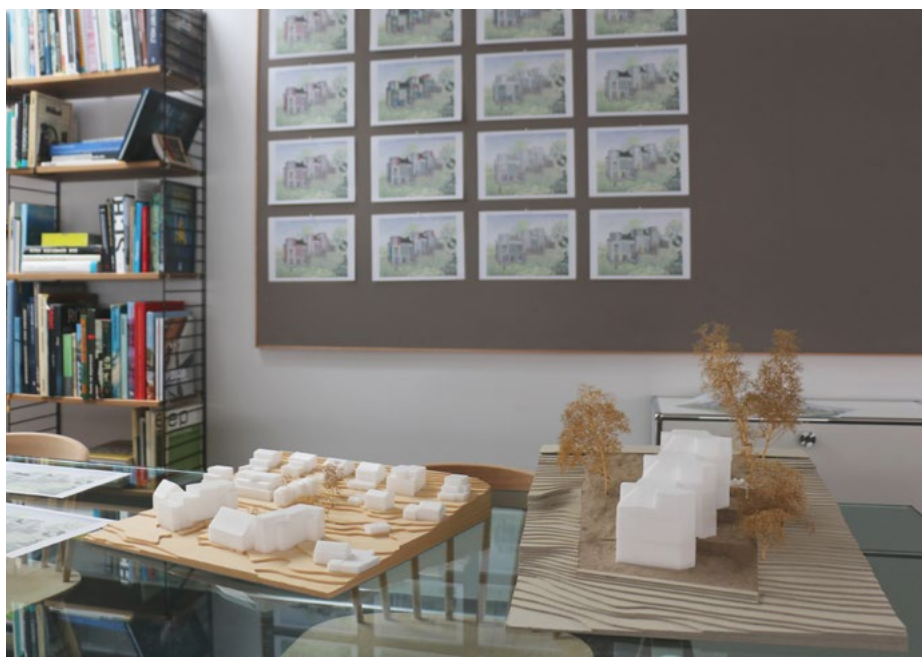
Zeichnungen und Modelle zu den projektierten Reihenhäusern in Geroldswil.

An der Badenfahrt 2017, dem sporadisch veranstalteten Stadtfest, betrieben Sie zusammen mit Freunden und Freundinnen die «Bar aus