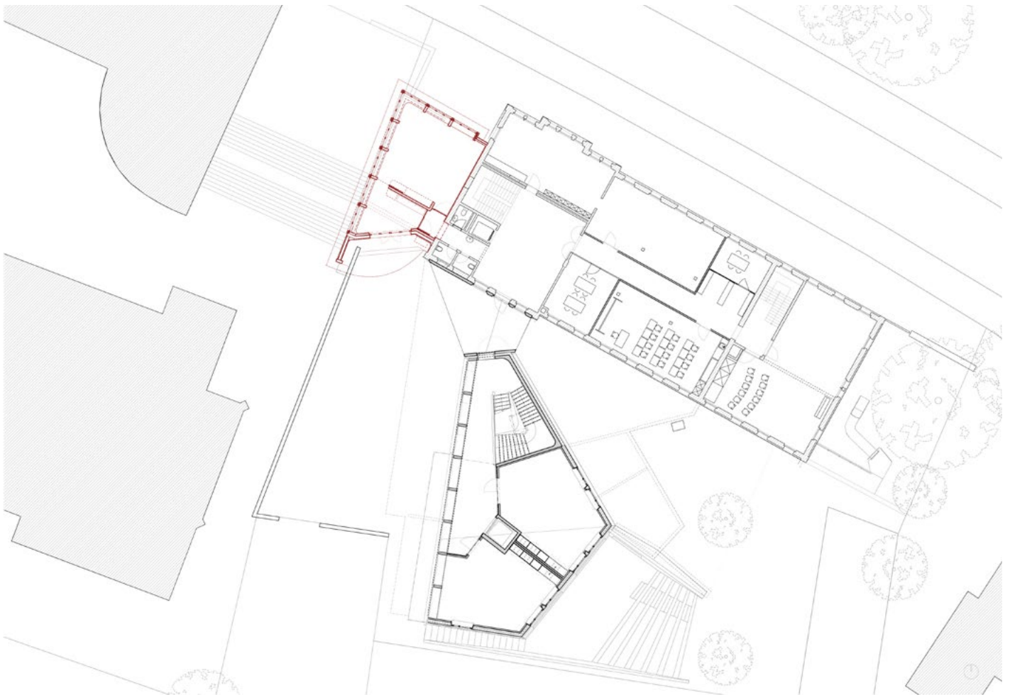
Standort an exponierter Stelle für den Neubau der Rudolf Steiner Sonderschule Lenzburg. Plan: SuM Architekten GmbH, Baden.