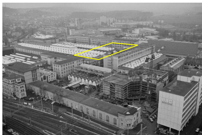
Als die Fabrikgebäude auf dem MFO-Gelände noch standen. Markiert ist ungefähr die Stelle, wo heute der Park steht.

Solch städtebauliche, denkmalpflegerische und ökonomische Faktoren prägten das Projekt stark. Eine wichtige Rolle spielte auch die Ökologie. Was die Überlegungen für ein Umsetzen zur Verbesserung des Stadtklimas anbelangt, darf raderschallpartner als vorbildlich angesehen werden. Auch beim MFO-Park nahm das Landschaftsarchitekturbüro vor mehr als zwanzig Jahren vieles bereits vorweg, was heute als selbstverständlich gelten sollte: der wasserdurchlässige Bodenbelag etwa oder das Sammeln des Regenwassers in Zisternen, das – in einen Kreislauf eingebunden – der Bewässerung der Pflanzen dient. Zudem sei hier, so Sibylle Aubort Raderschall, aufgrund der schieren Anzahl sowie der grossen Vielfalt an Kletterpflanzen eine «unglaubliche Biomasse und Fülle von Arten» vorhanden, was der Biodiversität sehr zuträglich sei.