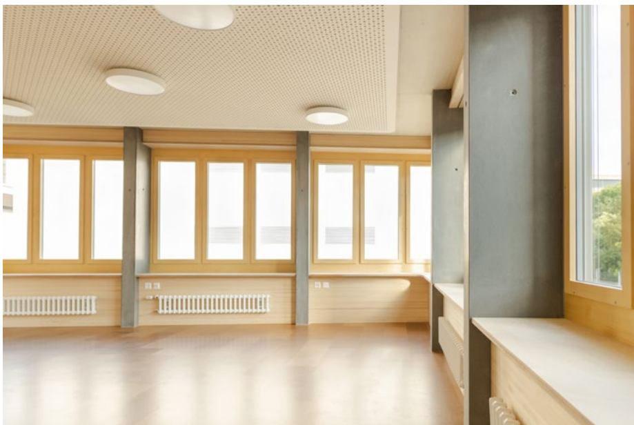
Der Neubau der Rudolf Steiner Sonderschule Lenzburg.