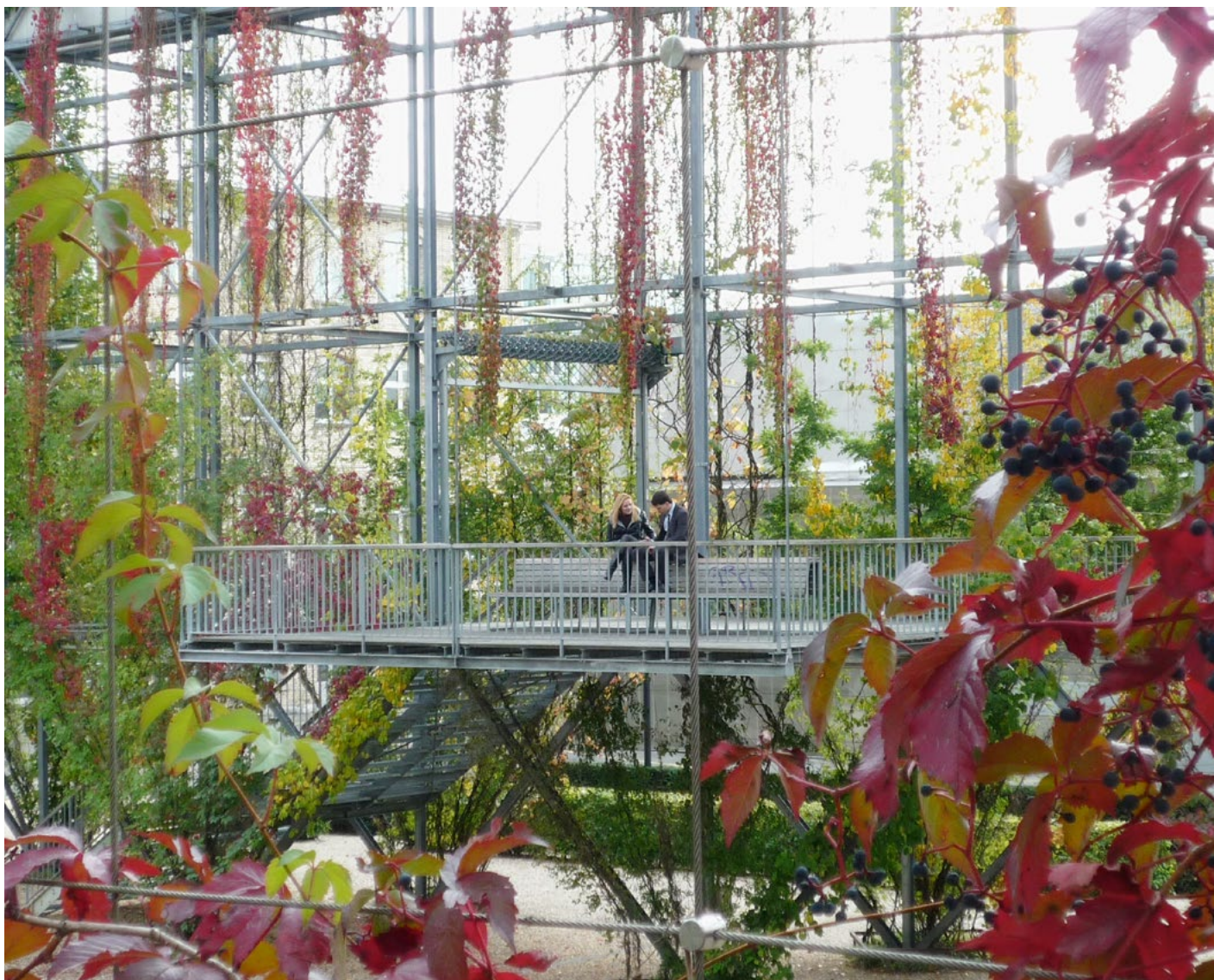
Jede Jahreszeit hat ihren Reiz.