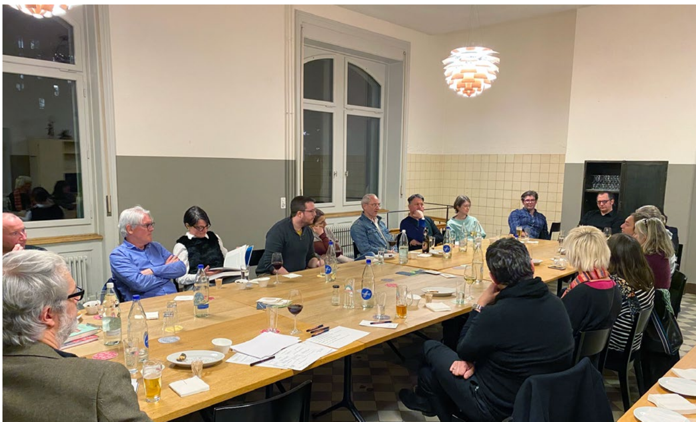
Angeregt im Gespräch am ersten Küchengespräch vom 9. Februar 2022.

Die nächsten Küchengespräche werden am Mittwoch, 15. Juni und Donnerstag, 25. August 2022 wiederum in der Militärkantine in St.Gallen durchgeführt. Dabei sollen die bereits aufgestellten Thesen vertieft diskutiert werden. Gäste aus anderen Ortsgruppen sind herzlich willkommen. Weitere Informationen gibt's schon bald auf https://www.werkbund-ost.ch .