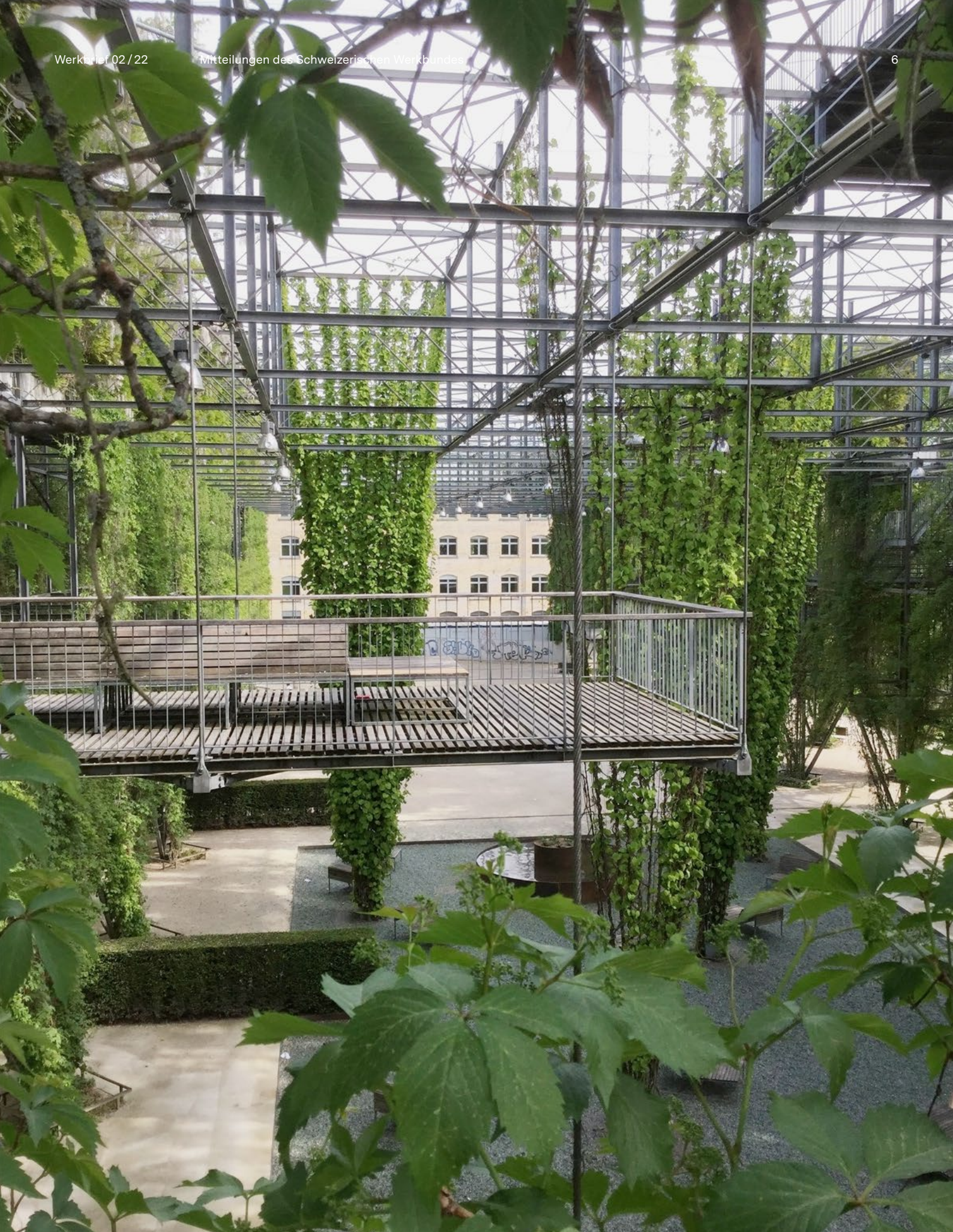
Rund 1300 Kletterpflanzen finden sich im MFO-Park.