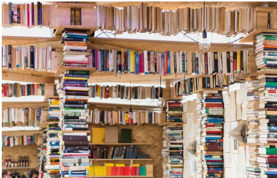
Der fertiggestellte Pavillon verströmte eine besondere Atmosphäre.

Das Mobiliar, das nach denselben Prinzipien wie die Trägerelemente erstellt wurde, fand im Nachgang zur Badenfahrt grossen Anklang. Auch ganze Teile der Pavillon-Konstruktionen wurden von Privatpersonen oder Bibliotheken als Zierelemente übernommen. Der Rest landete dann