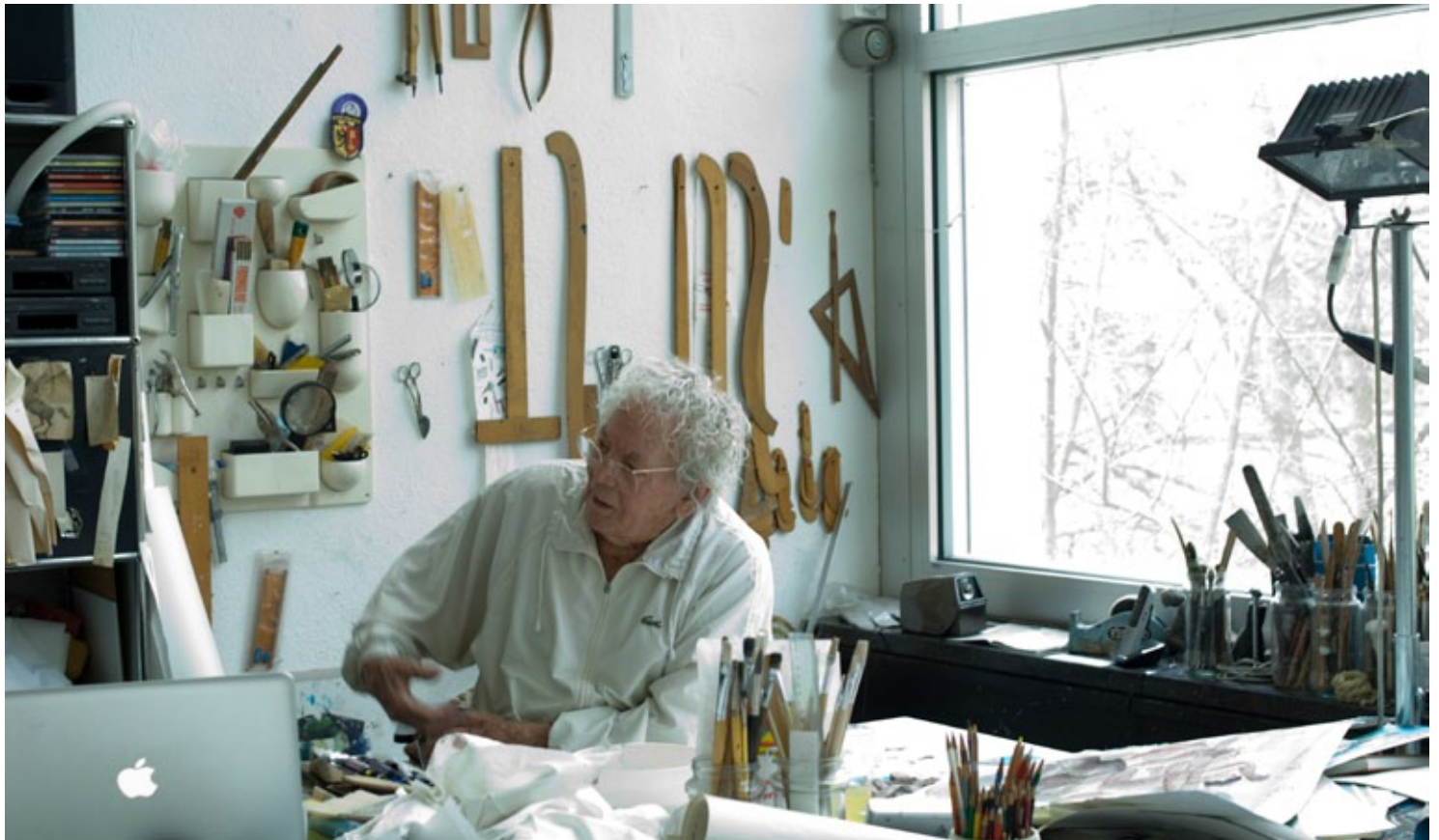
Hans Erni, Maler, * 1909, in seinem Atelier in Luzern.