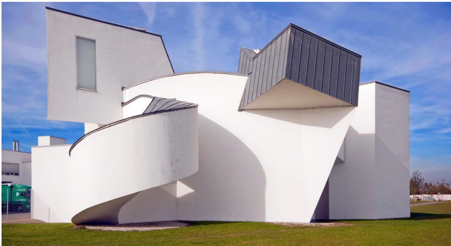
Das Vitra Design Museum von Frank O. Gehry.

Wir freuen uns, Sie am kommenden Samstag, 5. März 2011, zur Werkbundversammlung 2011 im Vitra Design Museum in Weil am Rhein begrüssen zu dürfen.