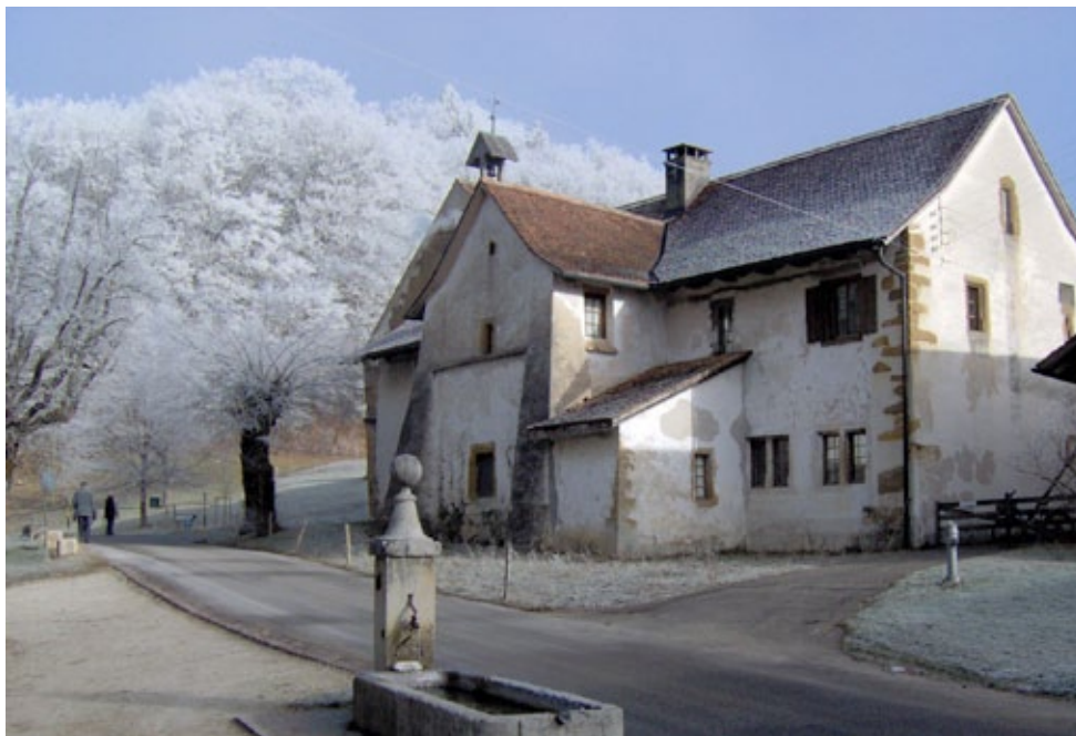
Das ehemalige Kloster in Schönthal.

Werkbund-Tag 2011 zum Thema «Echo» in Schönthal